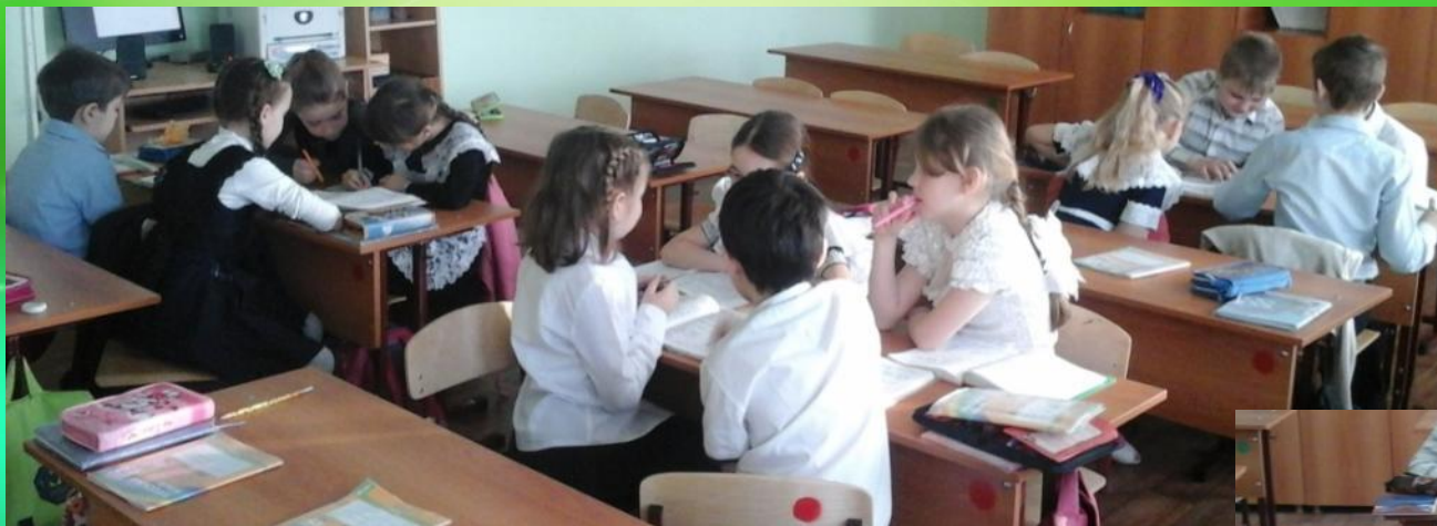
Работа в группах