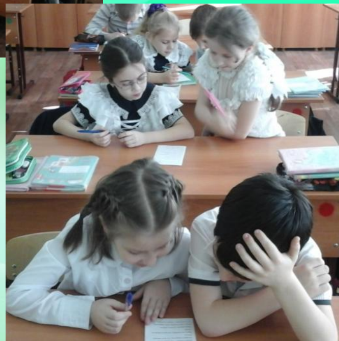
Работа в парах