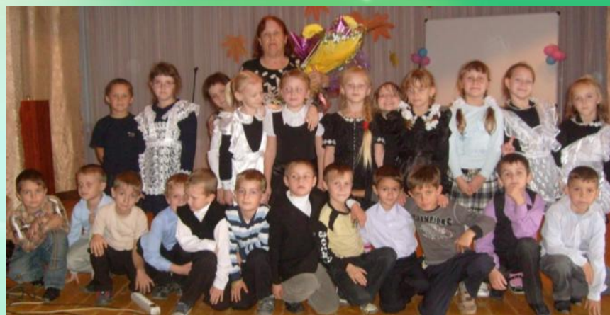
Встречи с интересными людьми