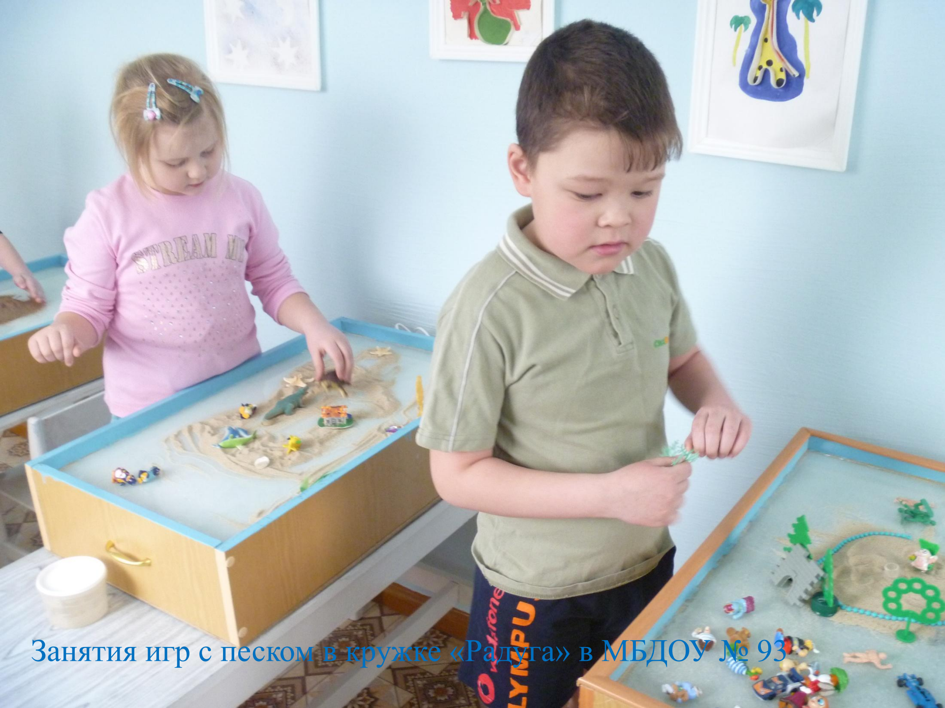
Занятия игр с песком в кружке «Радуга» в МБДОУ № 93