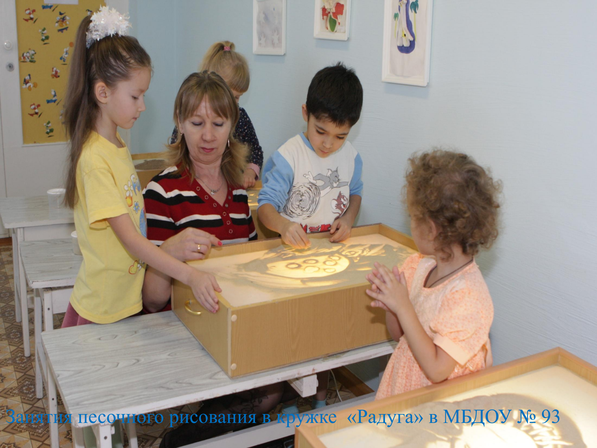
Занятия песочного рисования в кружке «Радуга» в МБДОУ № 93