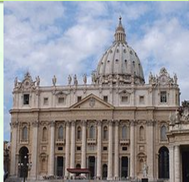
Собор святого Петра в Ватикане, построенный над предполагаемой могилой апостола Петра