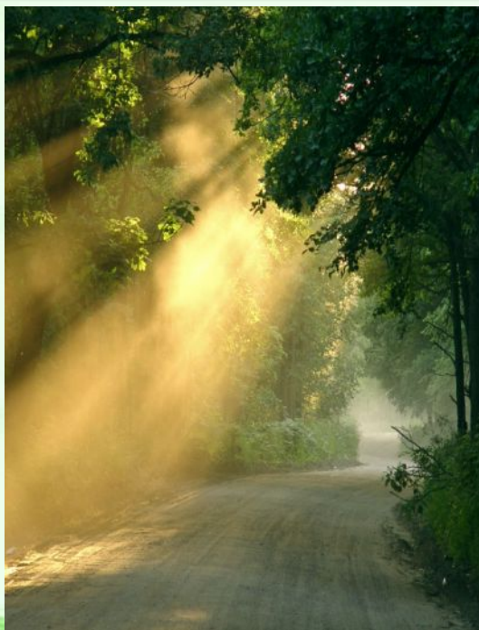
Санкт-это святой человек

Имя Пётр (Petrus, от греч. πέτρος — камень) возникло от прозвища Кифа (арам. — камень), которое ему дал Иисус.