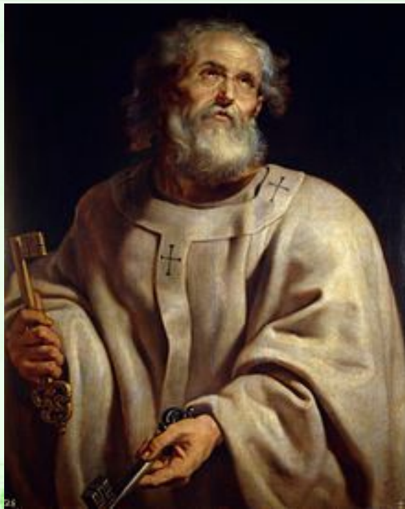
Рубенс , «Апостол Пётр»