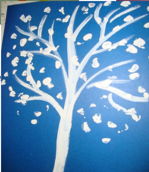
Дерево в снегу