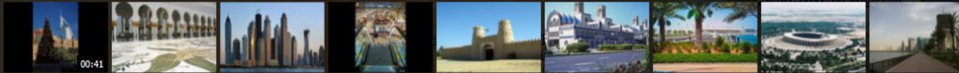
Арабская Башня Абу-Даби Дубай Объединённые Ар... Аль-Айн Шарджа Yas Kartzone Зайед Спорт Сити Шарджа