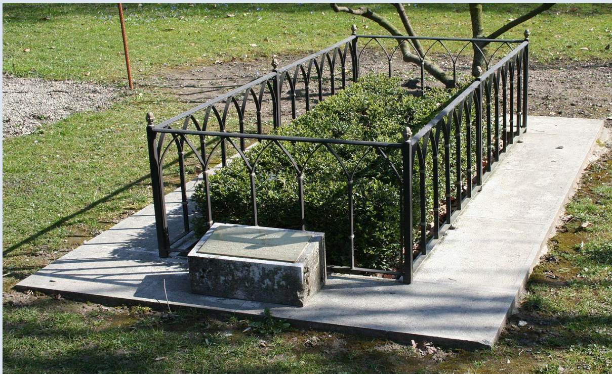
Предполагаемое место захоронения Кальвина

Жан Кальвин умер 27 мая 1564 года. Он был похоронен без церемоний, без памятника на могиле. Вскоре место его захоронения было утеряно.