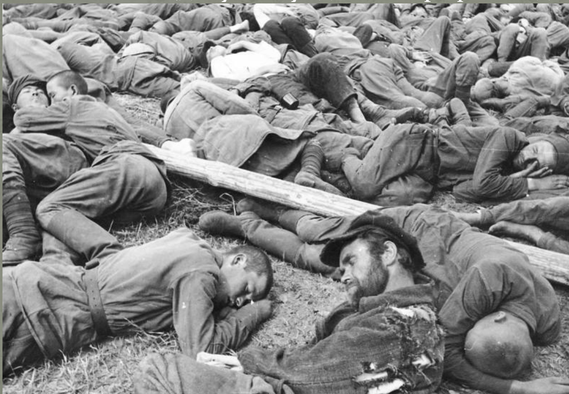
3. Juli 1942