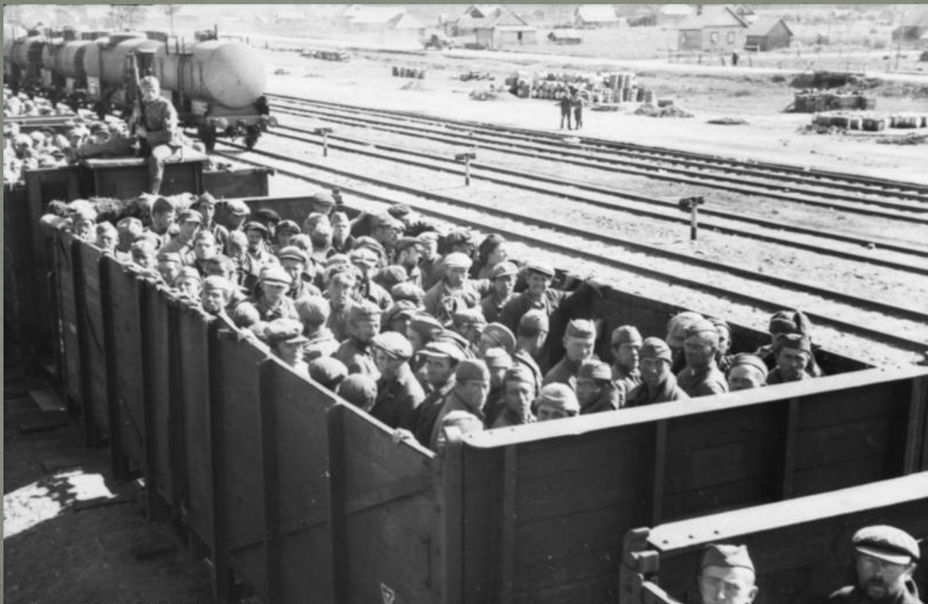
21. September 1941