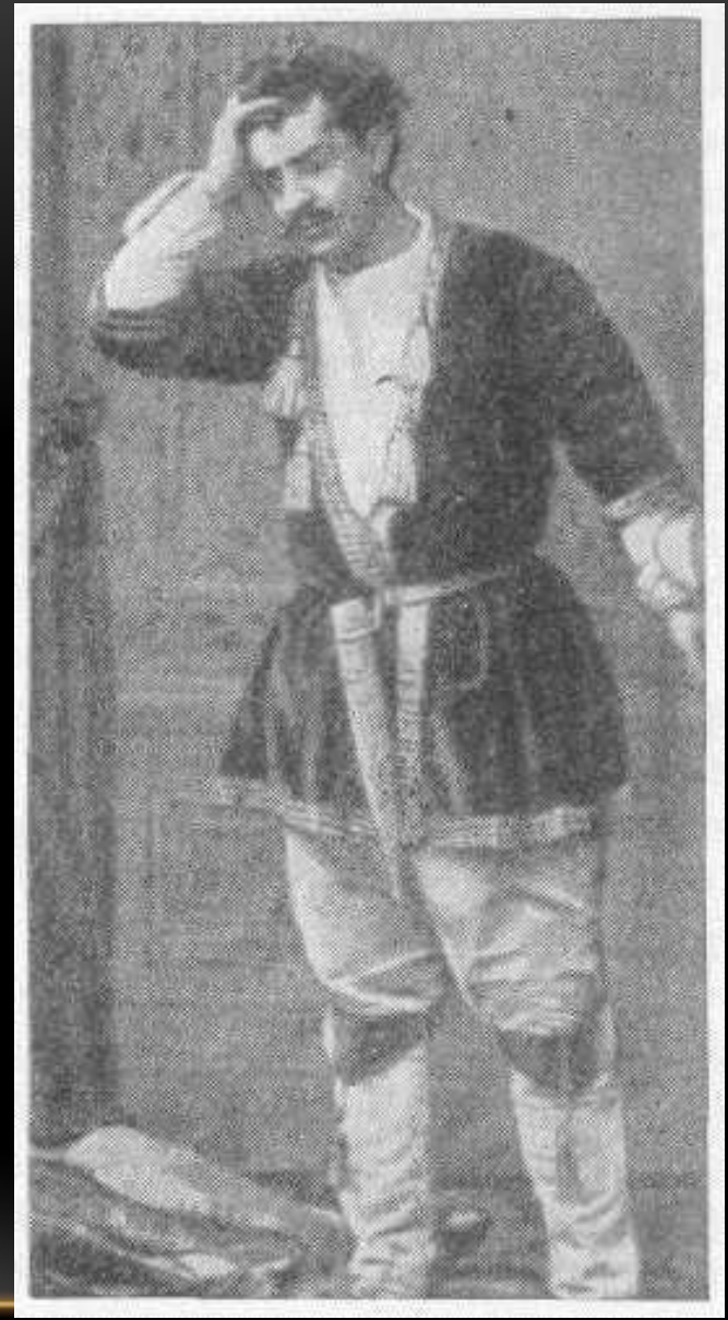
Кулигин из пьесы "Гроза" А.Н. Островского

Противопоставление Кулигина "темному царству" особенно выразительно в сцене столкновения с Диким. Кулигин — незаурядный человек. Но не его назвал Добролюбов "лучом света в темном царстве". Почему? Да потому, что Кулигин бессилен, слаб в своем протесте. Так же как и Тихон, как Борис, Кулигин боится самодурной силы, склоняется перед ней. "Нечего делать, надо покориться!" — говорит он смирненно. Кулигин и других учит покорности. Так, он советует Кудряшу: "Лучше уж стерпеть". То же рекомендует он и Борису: "Что же делать-то, сударь. Надо стараться угодить как-нибудь".