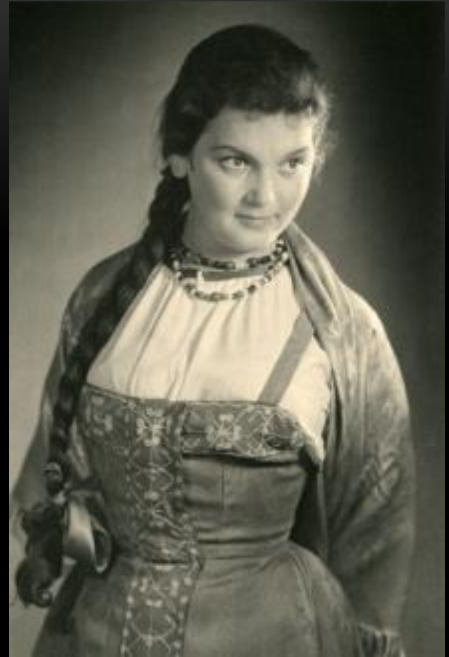
Варвара из пьесы "Гроза" А.Н. Островского