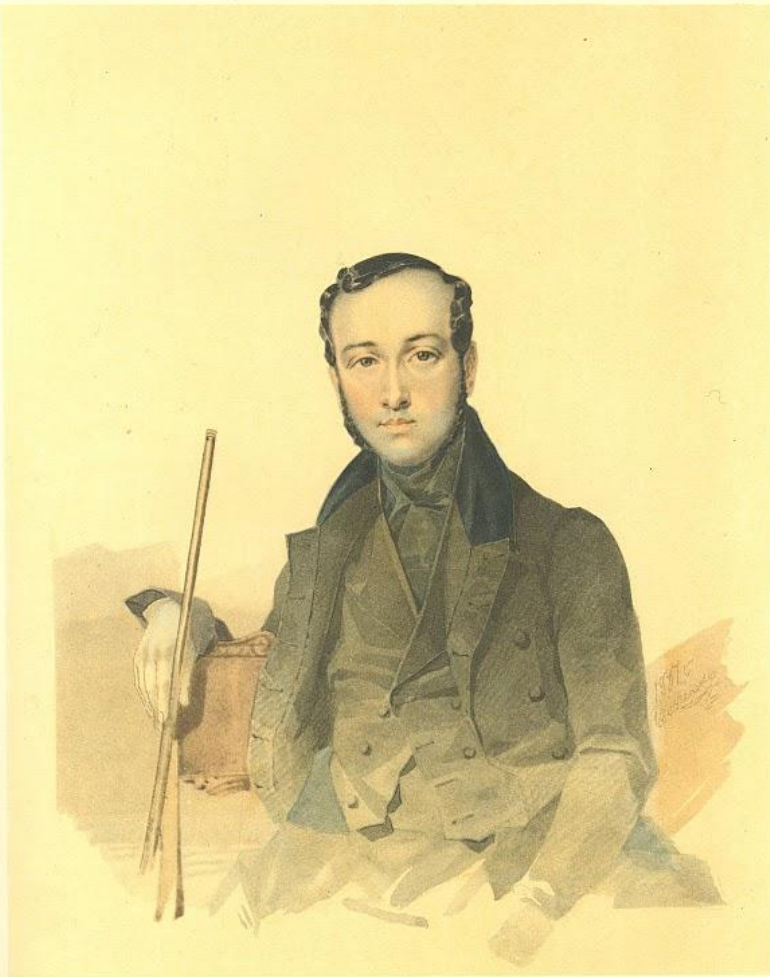
11. ПОРТРЕТ Є. П. ГРЕБІНКИ. Акварель. 1837.