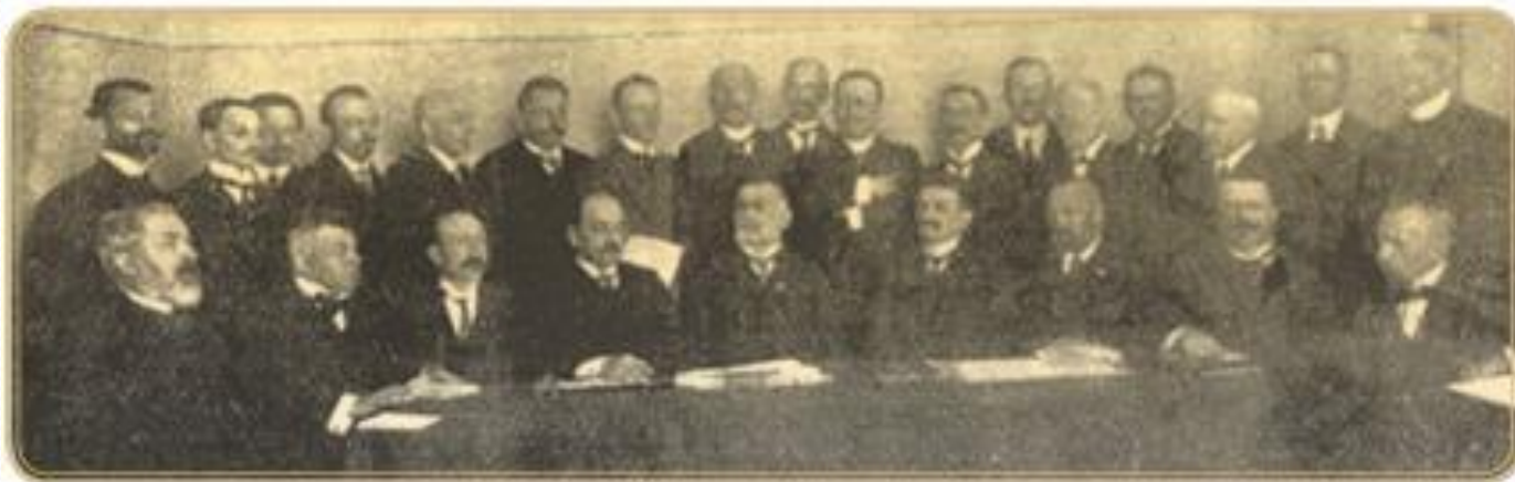
Лідери Головної Української ради (ГУР)