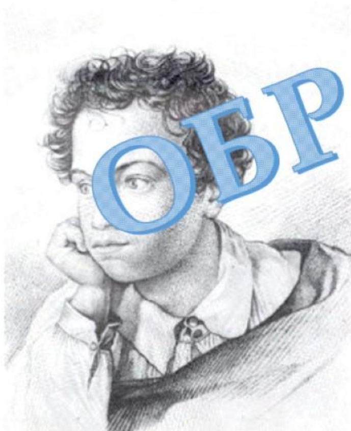
Пушкин в возрасте 12-14 лет

Утром 9 октября 1811 года в недавно открытый в Царском Селе Императорский лицей прибыл воспитанник Александр Пушкин. Ему досталась комната за номером 14. В этой комнате он провел 6 лет.