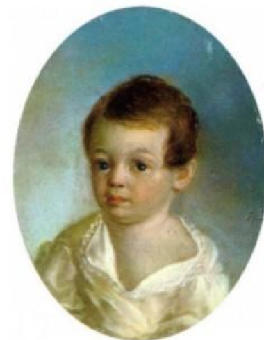
А. Пушкин в детстве