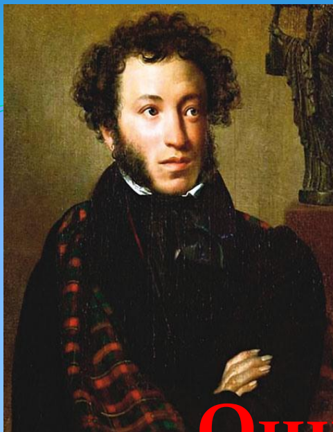
А.С.Пушкин - поэт