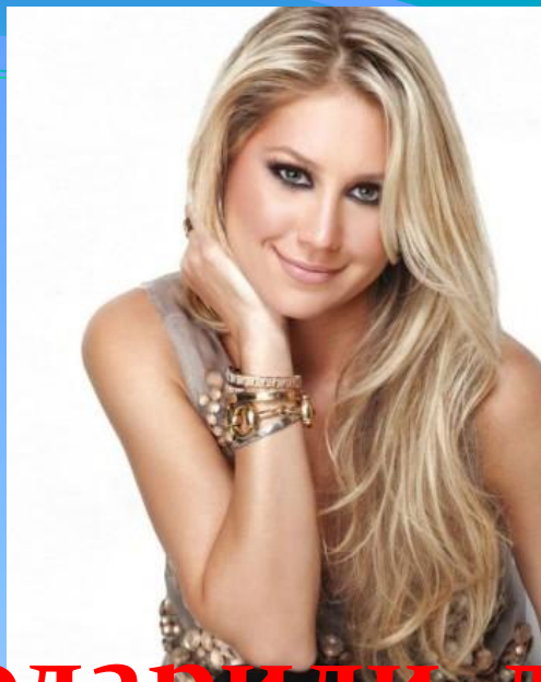
Анна Курникова -