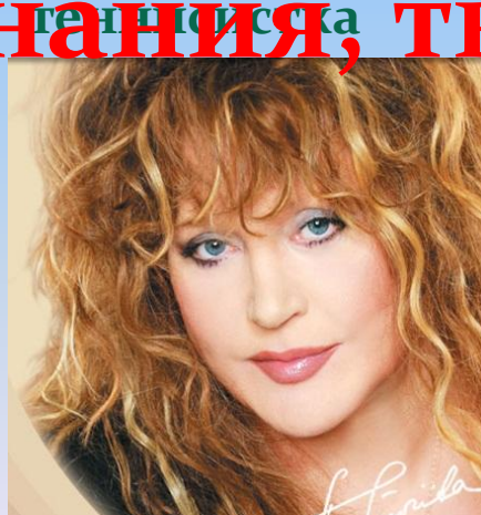
А.Б.Пугачева - певица