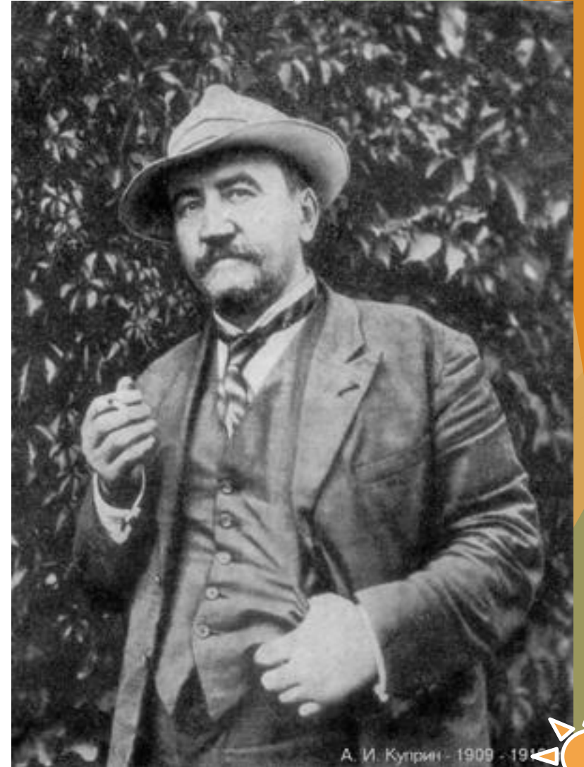
А. И. Куприн - 1909 - 1911

В 1890-е опубликовал очерк "Юзовский завод" и повесть "Молох", рассказы "Лесная глушь", "Оборотень", повести "Олеся" и "Кэт" ("Прапорщик армейский").