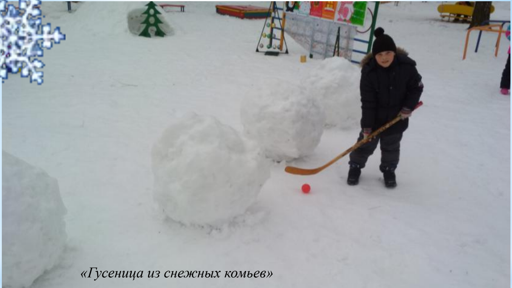
«Гусеница из снежных комьев»

* Вести шайбу (мяч) клюшкой, не отрывая ее от шайбы (мяч). Вести шайбу (мяч) вокруг предметов и между ними.