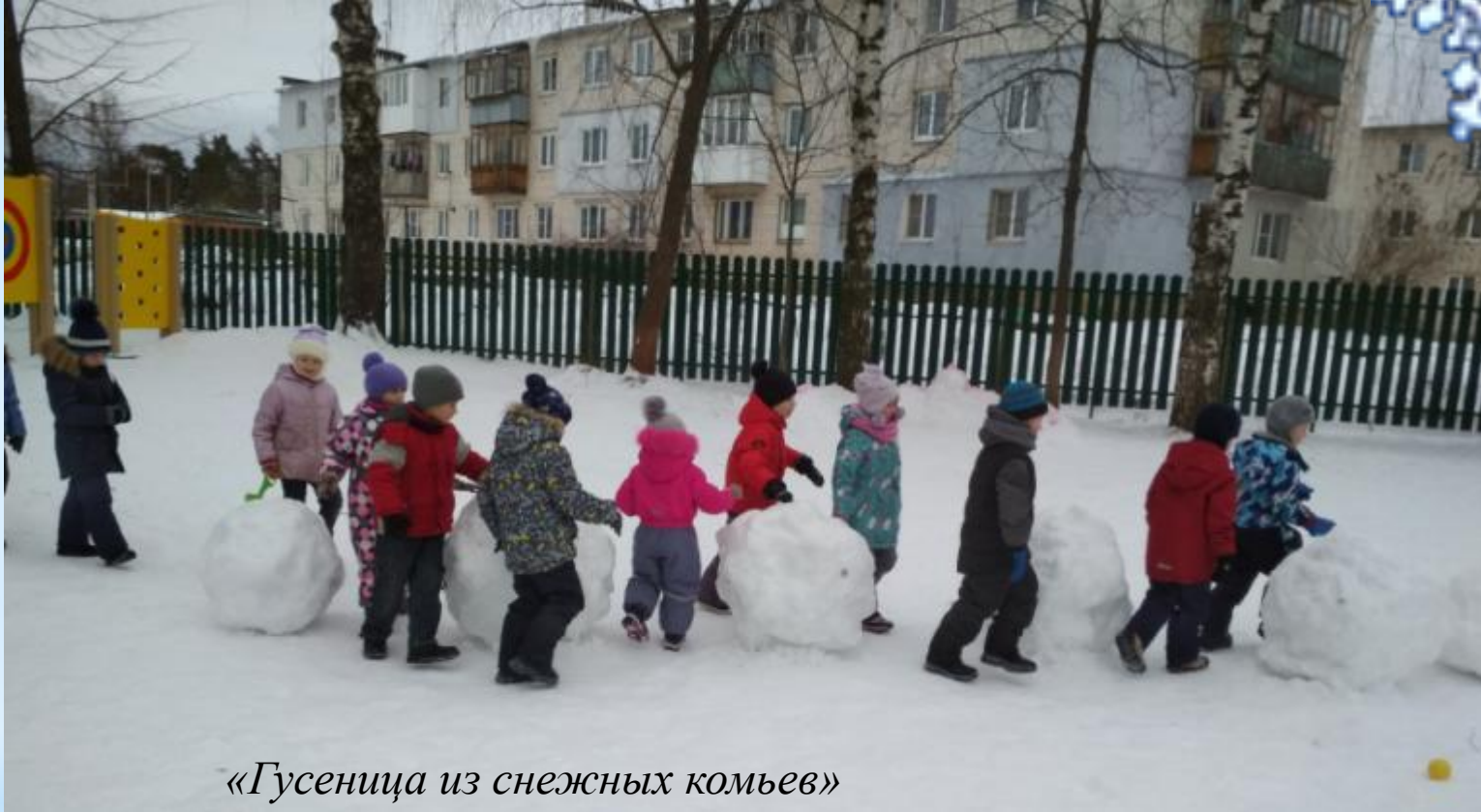
«Гусеница из снежных комьев»