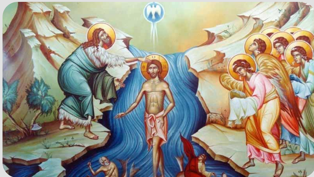
Богоявление. Крещение Господне

Всем спасибо за внимание! Храни Вас Бог!