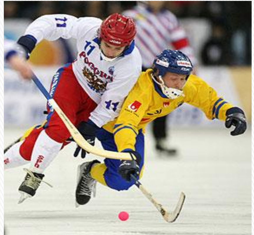
Хоккей с мячом