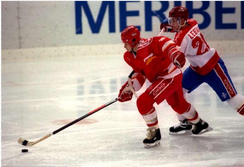
Хоккей с шайбой

Он играет на коньках. Клюшку держит он в руках. Шайбу этой клюшкой бьёт. Кто спортсмена назовёт? (Хоккеист)