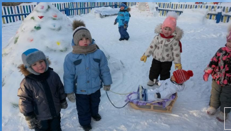
Саночки для катания куклы Тани.