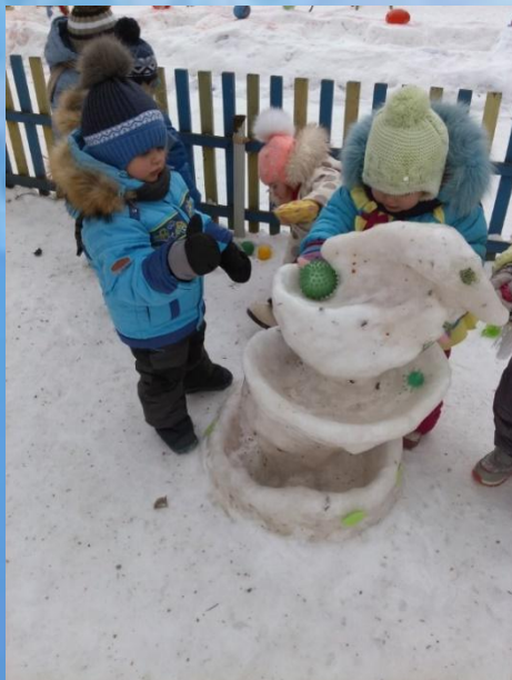
Змейка-спираль для запуска шариков.

Тихо падает снежок, То зима пришла, дружок, Мы играем, веселимся, И мороза не боимся!