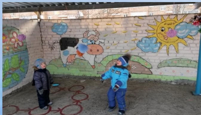
Помпоны, подвешенные на высоте для развития ловкости и меткости.