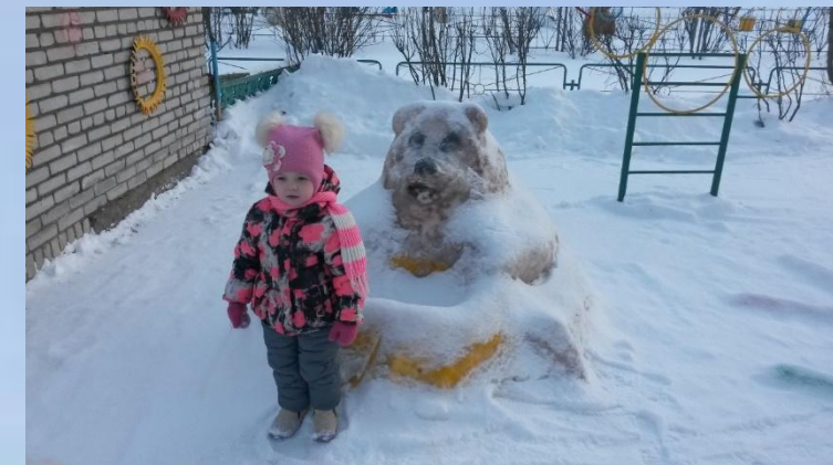
Мишка с бочкой для метания в нее шариков.

Тихо падает снежок, То зима пришла, дружок, Мы играем, веселимся, И мороза не боимся!