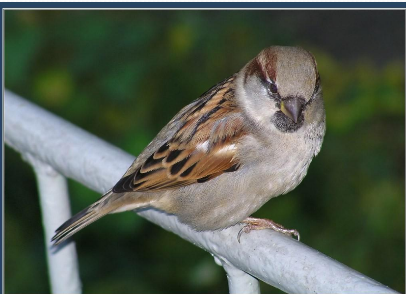
Воробей домашний ( Passer domesticus ) самец