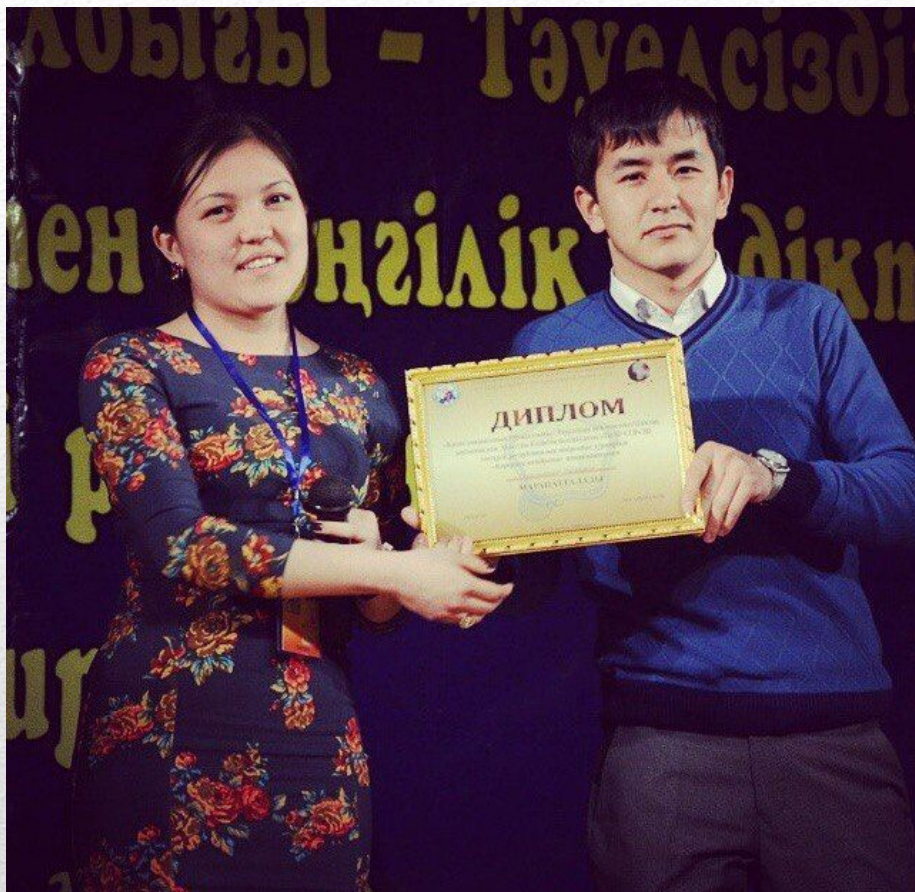
Тараз қаласында өткен TARSU CUP