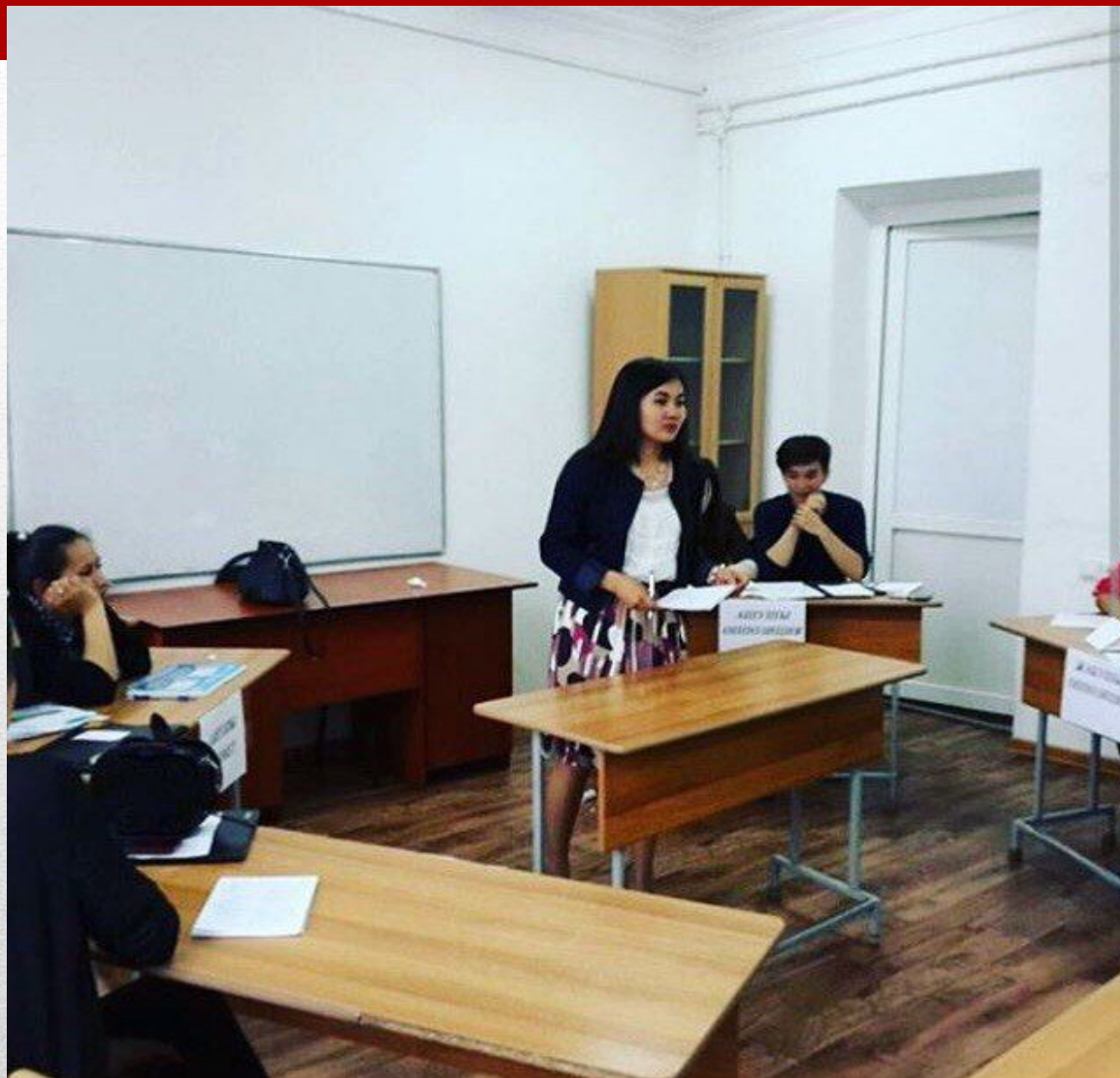
Семей қаласында өткен турнир