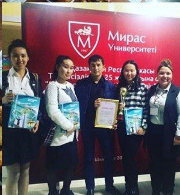
Мирас Университеті Ректоры кубогы. Жүлделі I орын.