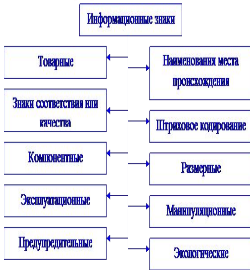
Рис. Классификация информационных знаков