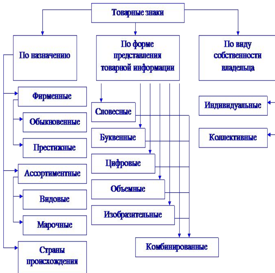
Рис. Классификация товарных знаков

○ Товарные знаки - это обозначения, способные отличать соответственно товары и услуги одних юридических лиц от однородных товаров и услуг других юридических или физических лиц.