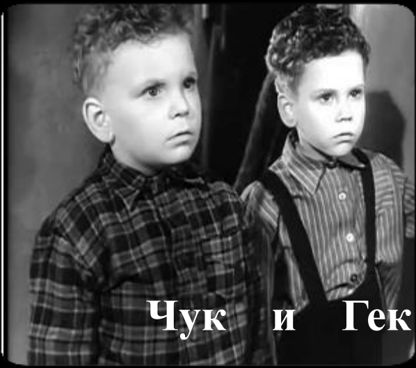
Чук и Гек