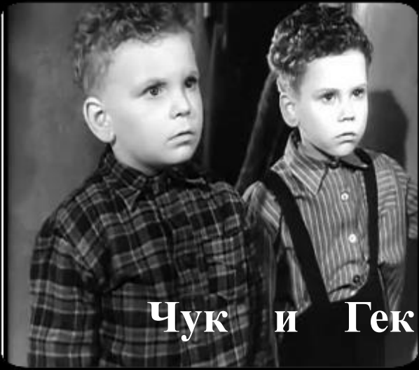
Чук и Гек