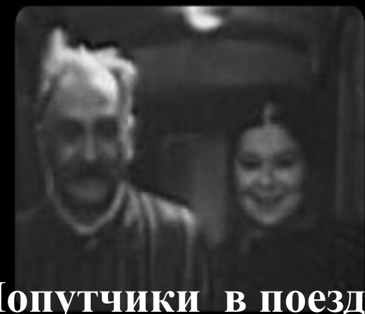
Попутчики в поезде