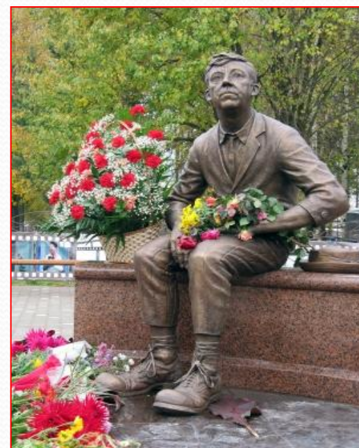
Памятник Никулину в Москве