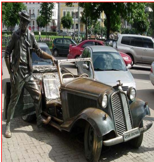
Памятник Никулину в Демидове