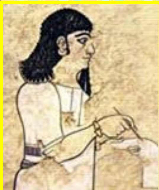
Ахикар Писец ассирийского царя Синахериба VIII - VII вв. до н.э.