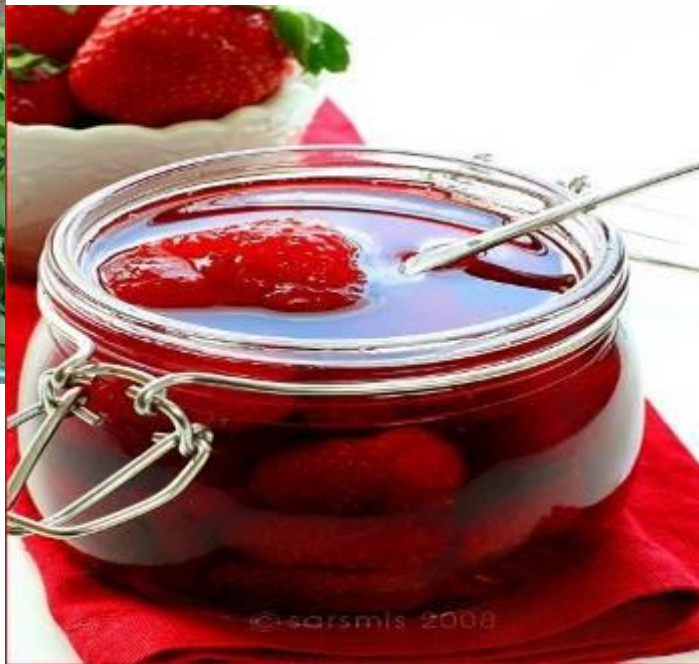
2. Клубничное варенье.