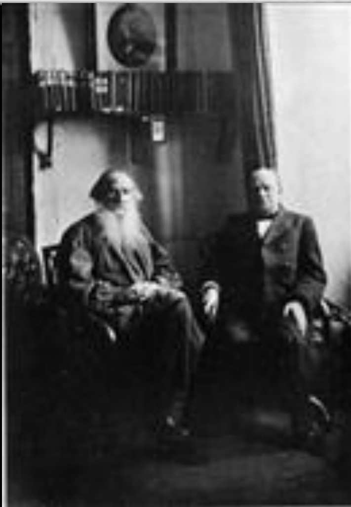
А.Ф. Кони с Л.Н. Толстым.