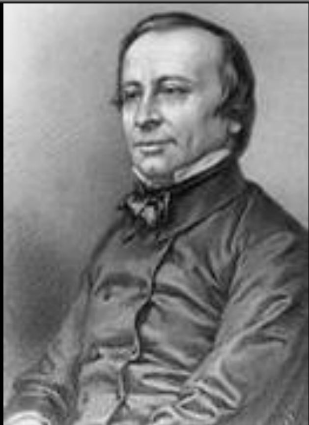
Эдуард Рене Лефевр де Лебулэ - французский писатель, правовед.

«Еще в юности глубоко врезались в мою память прекрасные слова Лебулэ: «В отношении бедняка, ребенка, женщины, даже если они являются подсудимыми, правосудие должно остерегаться могущества своей власти и поступать слишком рассудочно». Вот почему через 48 лет по оставлении мною прокурорской деятельности, я спокойно вспоминаю свой труд обвинителя и думаю, что едва ли между моими подсудимыми были люди, уносившие с собою, будучи поражены судебным приговором, чувство злости, негодования или озлобления против меня лично.»