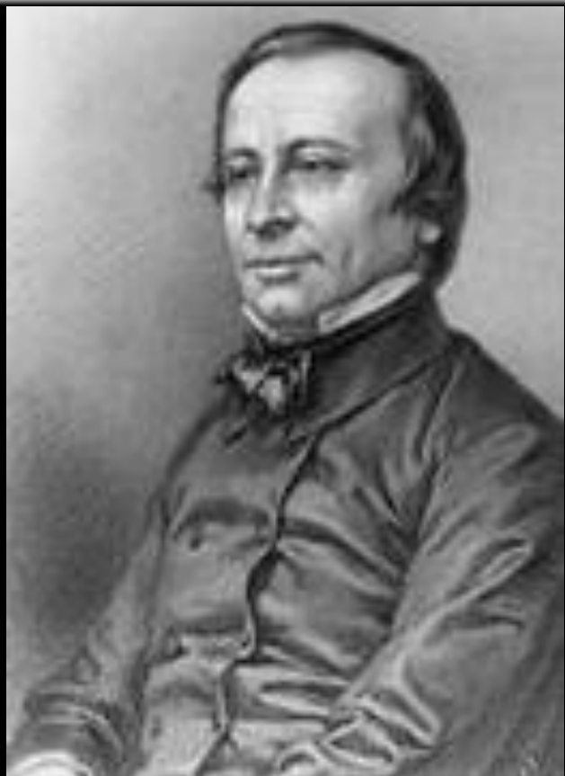
Эдуард Рене Лефевр де Лебулэ - французский писатель, правовед.

«Еще в юности глубоко врезались в мою память прекрасные слова Лебулэ: «В отношении бедняка, ребенка, женщины, даже если они являются подсудимыми, правосудие должно остерегаться могущества своей власти и поступать слишком рассудочно». Вот почему через 48 лет по оставлении мною прокурорской деятельности, я спокойно вспоминаю свой труд обвинителя и думаю, что едва ли между моими подсудимыми были люди, уносившие с собою, будучи поражены судебным приговором, чувство злости, негодования или озлобления против меня лично.»