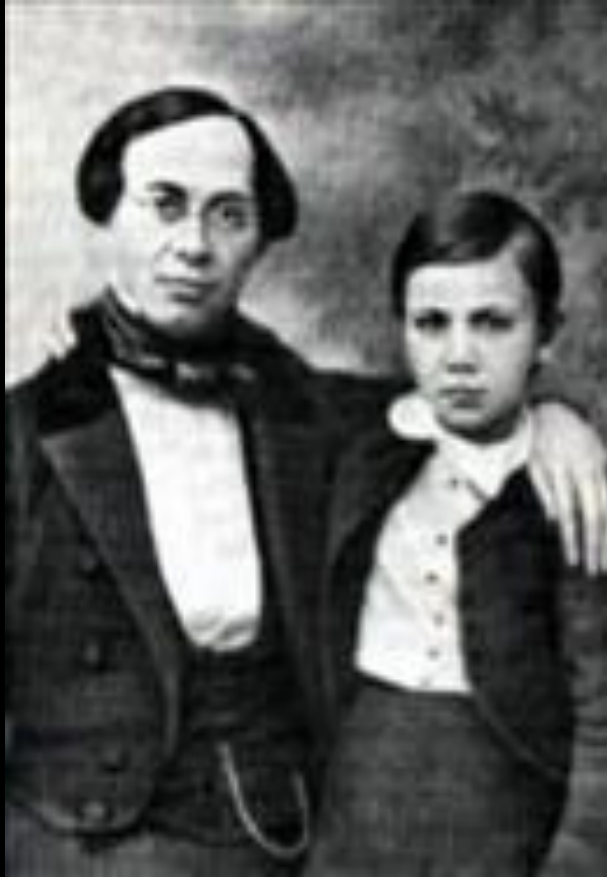
А.Ф. Кони с отцом – Ф.А. Кони.