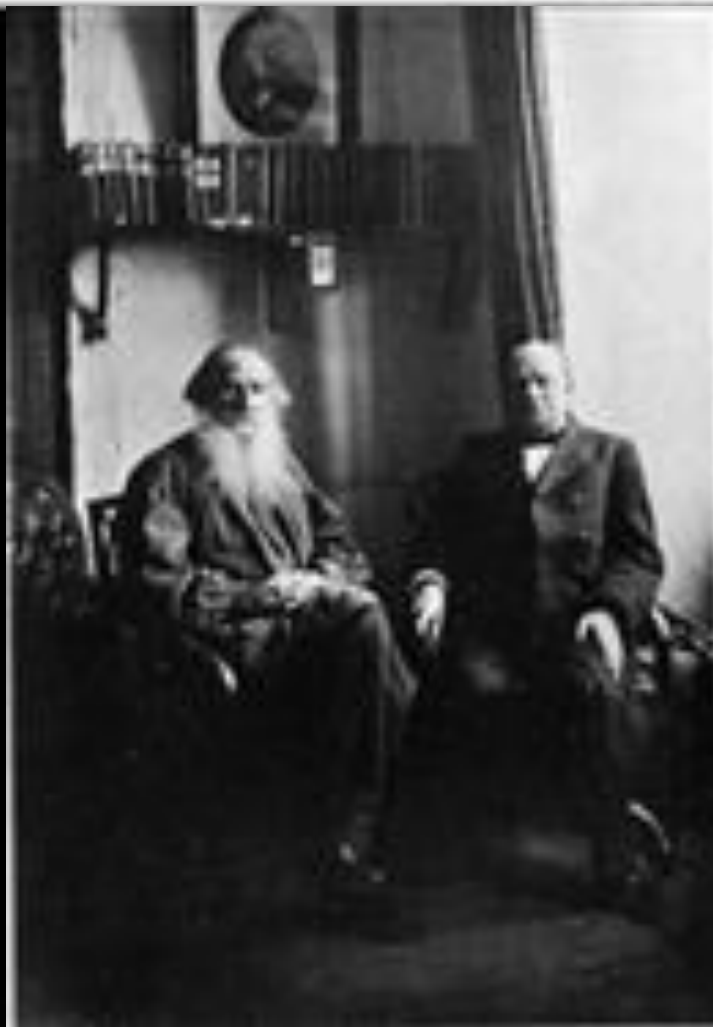
А.Ф. Кони с Л.Н. Толстым.