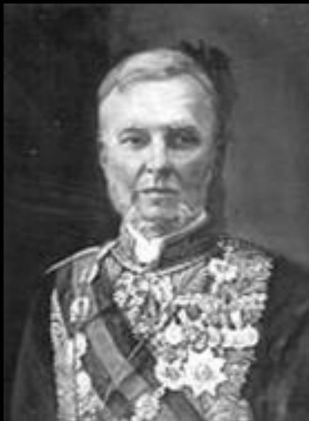
Граф Константин Пален