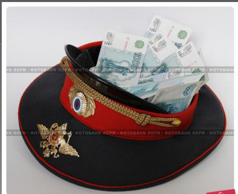
Деньги в фуражке