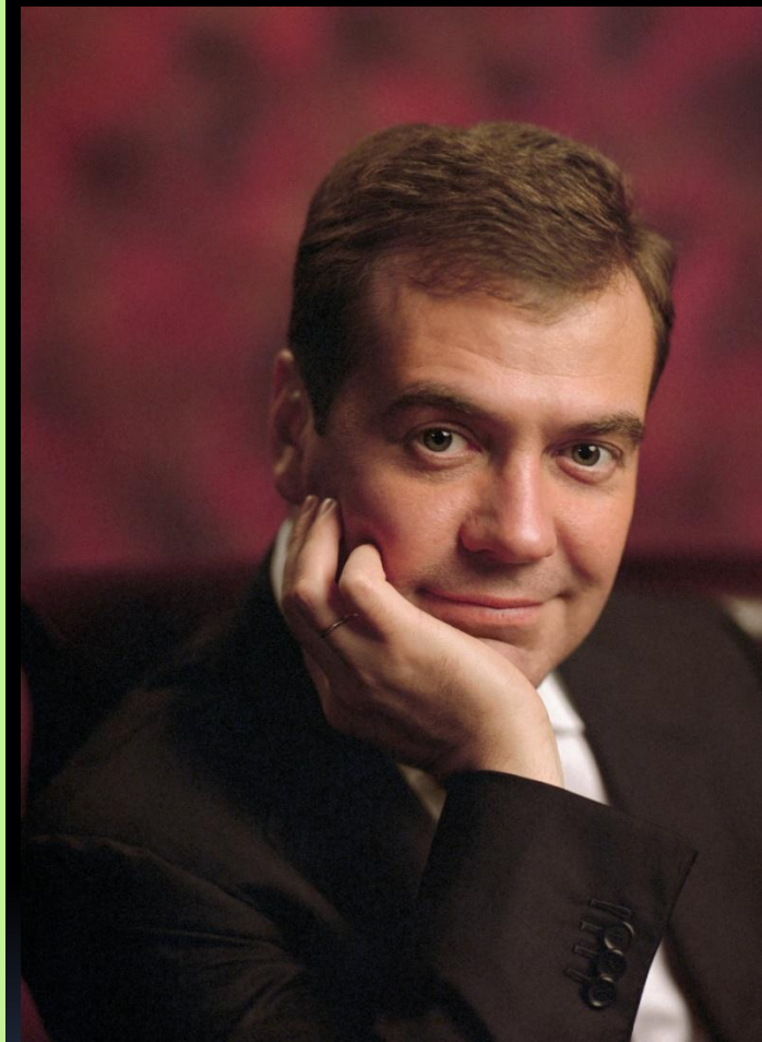
Президент РФ Дмитрий Медведев

Может быть отрешен от должности законодательной властью