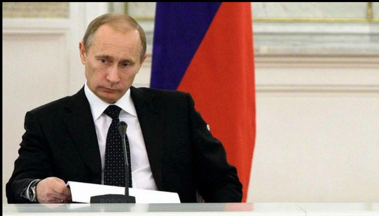
В.В.Путин Председатель Правительства РФ