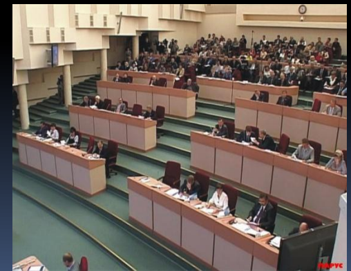
Саратовская областная Дума