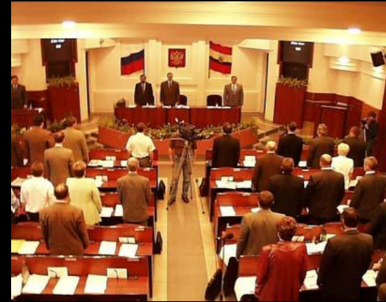
Курская областная Дума