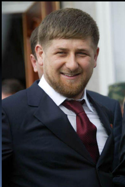
Рамзан Кадыров Глава Чеченской республики