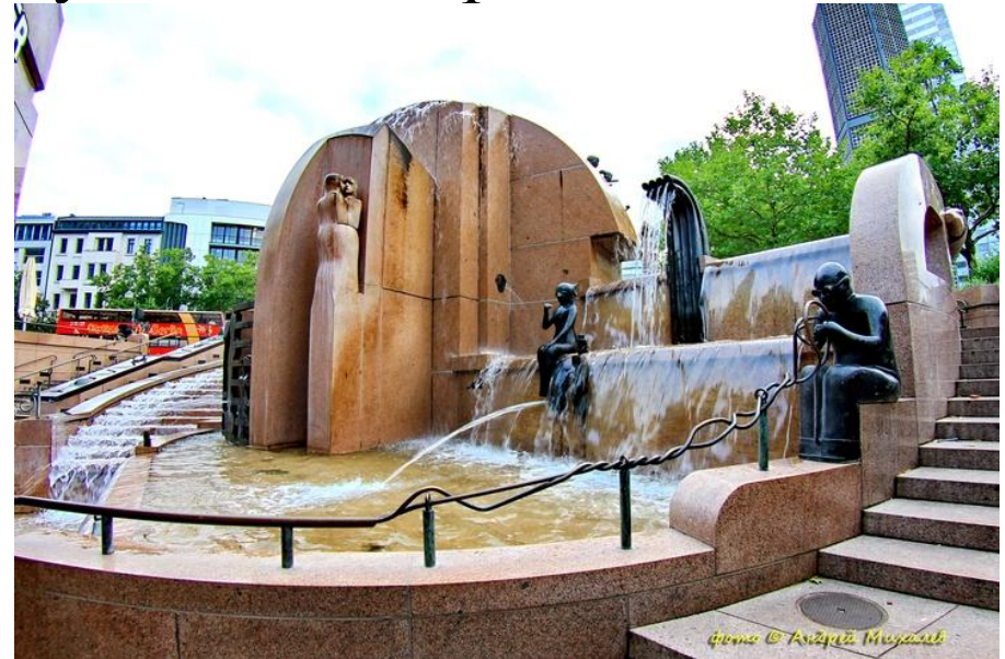
Фонтан «Земной шар», Берлин