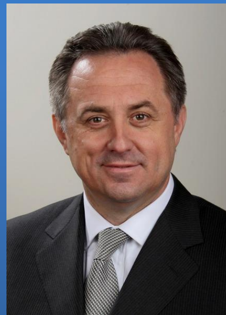
Виталий МУТКО С 21 мая 2012 По 18 октября 2016 года