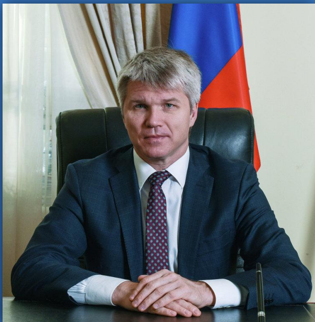
Павел КОЛОБКОВ С 21 октября 2016 года