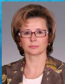
Паршикова Наталья Статс-секретарь - заместитель министра