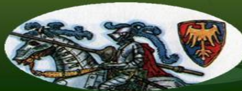
Налоговая и финансовая система