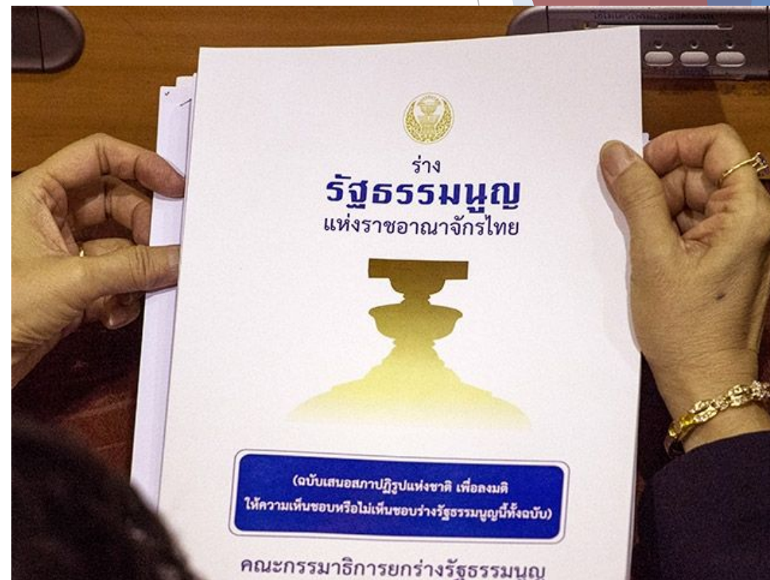
Конституция королевства Таиланд 2017 года