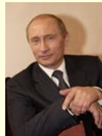
ПУТИН В. В.