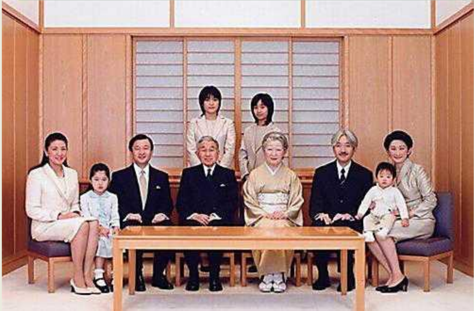
Сім'я імператора Японії