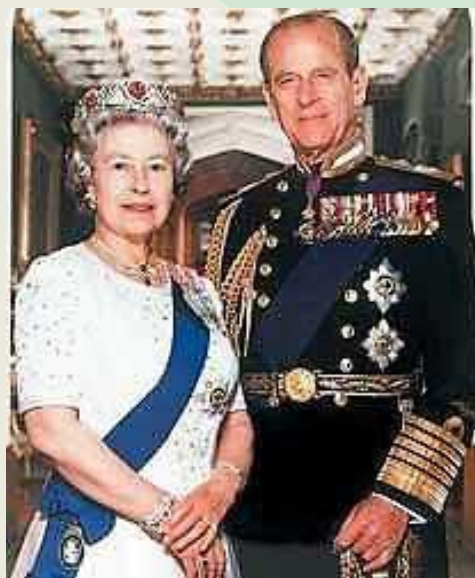
Королева Великої Британії