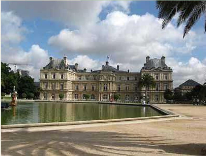
Палац Герцога Люксембургського