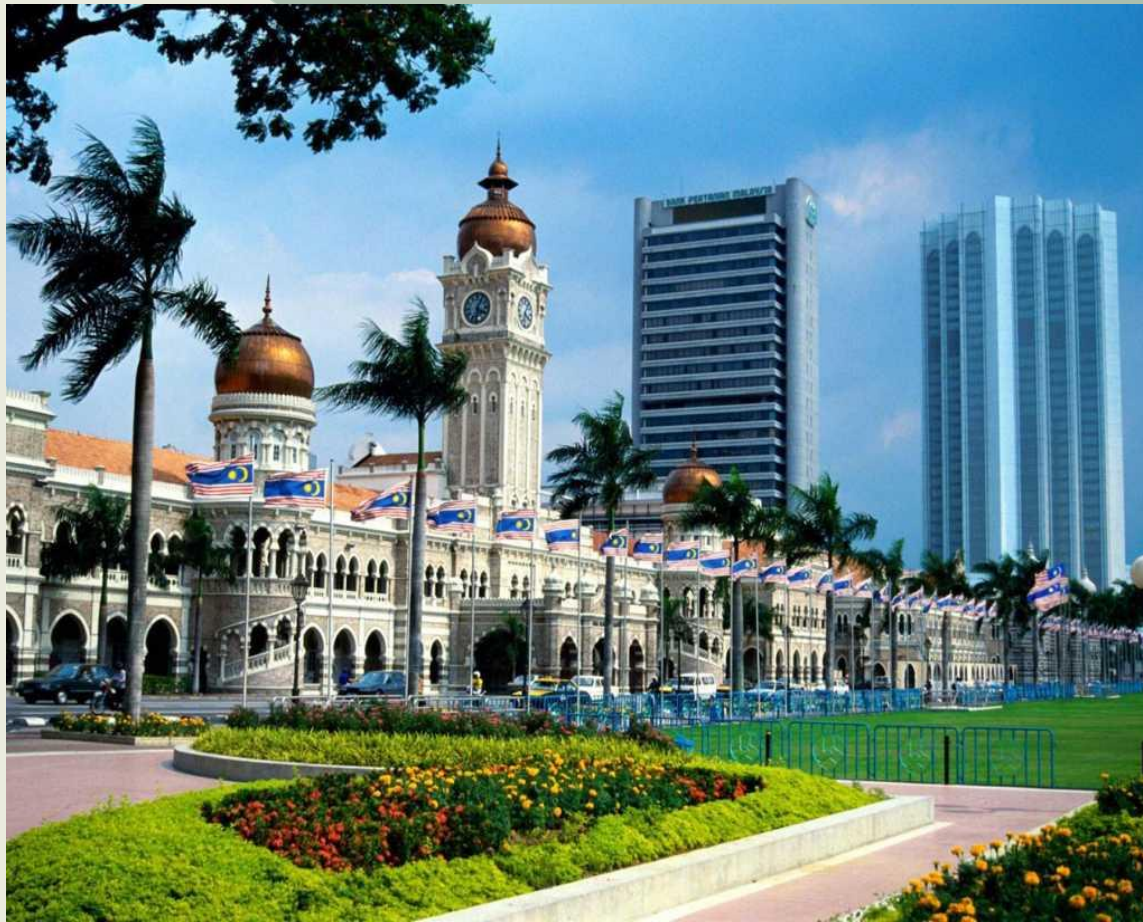
Палац султана Малайзії