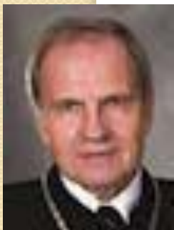
ЗОРЬКИН Валерий Дмитриевич Председатель Конституционного Суда РФ