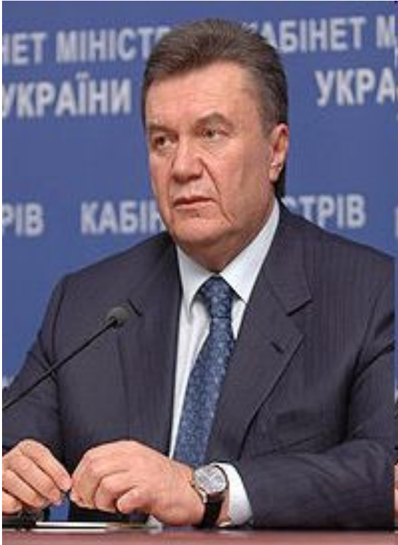
В. Ф. Янукович, президент України з 2010 року

Президент України згідно з статтею 102 Конституції України є главою держави, гарантом державного суверенітету, територіальної цілісності України, додержання Конституції України, прав і свобод людини і громадянина. На основі та на виконання Конституції України і законів України Президент видає укази і розпорядження, які є обов'язковими до виконання на території України.