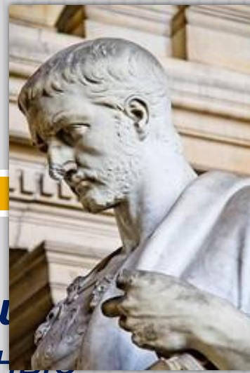
Римский юрист и государственный деятель III в. Учился у известного римского юриста Ульпиана.

б) диспозитивные нормы предписывают вариант поведения, но при этом представляют субъектам возможность в пределах законных средств урегулировать отношения по своему усмотрению.