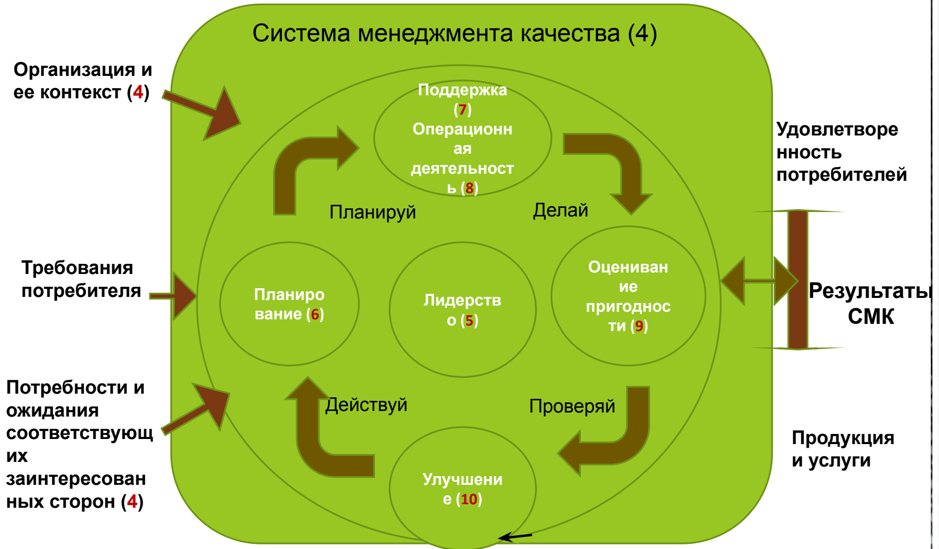
Схема процессного подхода