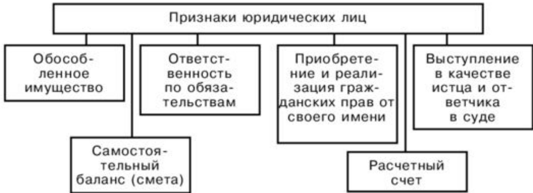
Рис. 3.1. Признаки юридических лиц