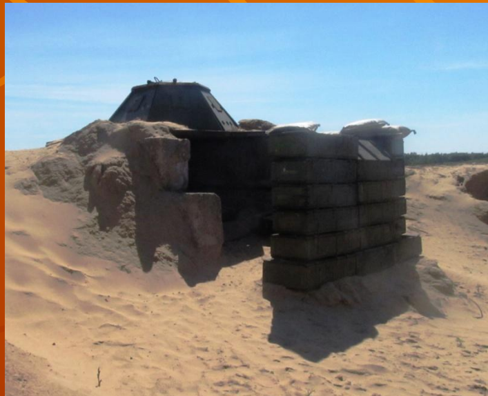
Захищений спостережний пост (2393ВП «Новомосковський»)