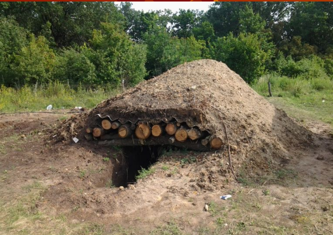
Укриття для особового складу (район АТО)