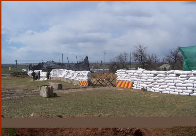
Контрольно-пропускний пункт (район АТО)