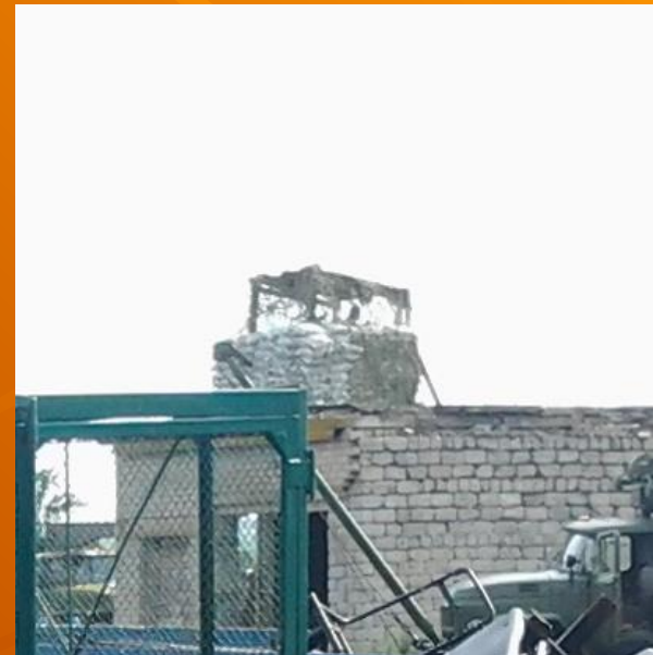
Спостережний пост на будівлі (район АТО)