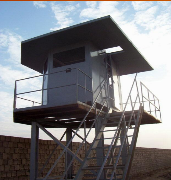
Спостережний пост (Ірак)