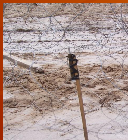
Сигнальна міна СМ