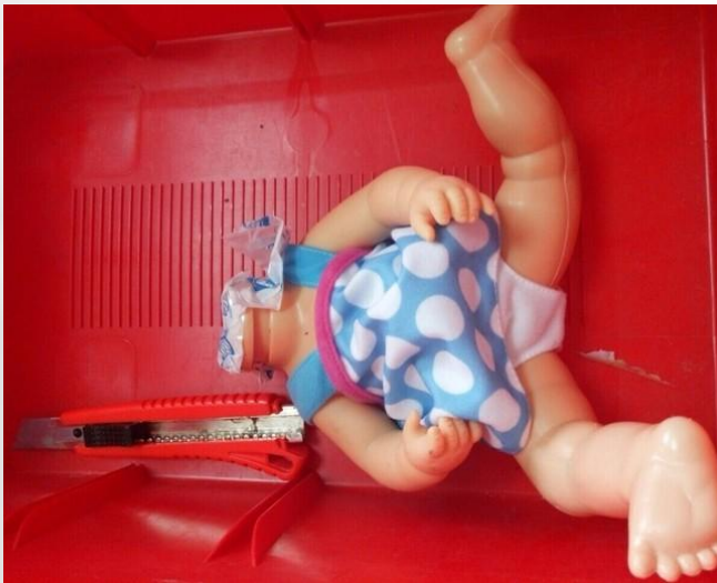
Рис 1. Кукла с сокрытыми резиновыми удавами

На Национальном правовом портале опубликован список организаций (Витебский, Гродненский, Жлобинский, Минский и Октябрьский зоопарки, Березинский биосферный заповедник, Национальные парки «Беловежская пуща» и пр.