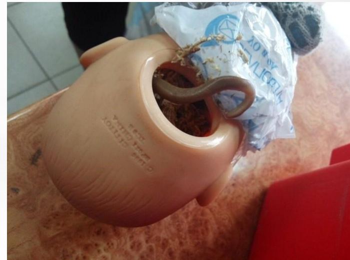
Рис. 2. Кукла с сокрытыми резиновыми удавами