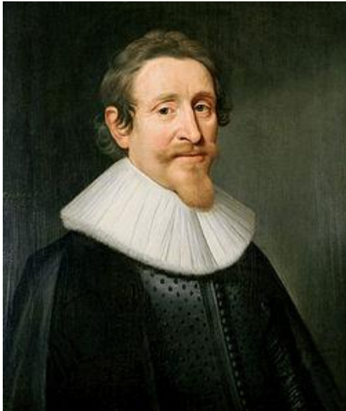
Г. Гроций, голландский юрист- международник (1583-1645)