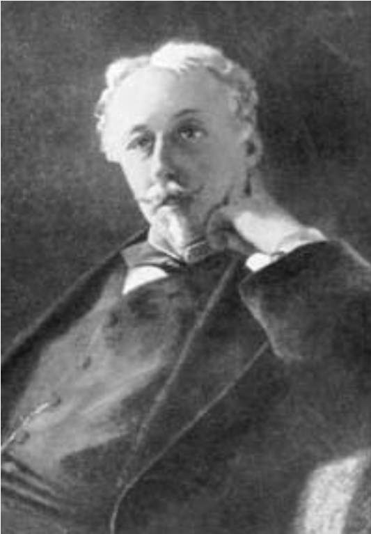
Ж.А. де Гобино