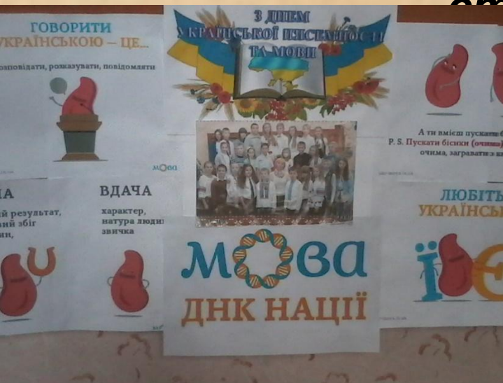
Фото колажі на тему « Мова – нації основа» - до Міжнародного дня рідної мови (від Бережанської міської школи лідерів учнівського самоврядування «Цвіт нації» Центру дитячої та юнацької творчості)