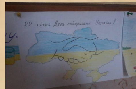
Конкурс малюнків "Соборна Укаїна — це значить, що наша держава єдина!"