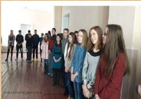
Шкільна лінійка, присвячена Дню Соборності України "Соборна Україна — одна на всіх, як оберіг"