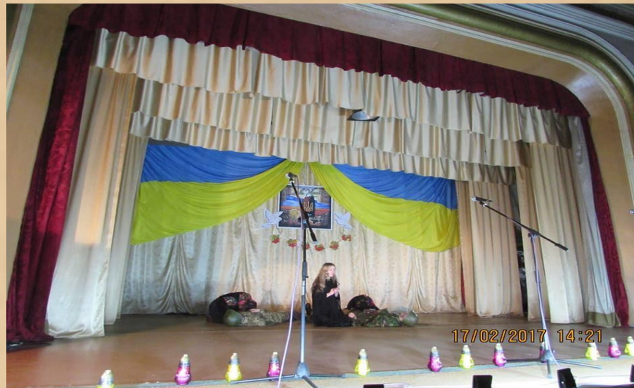
Бережанська ЗОШ №2