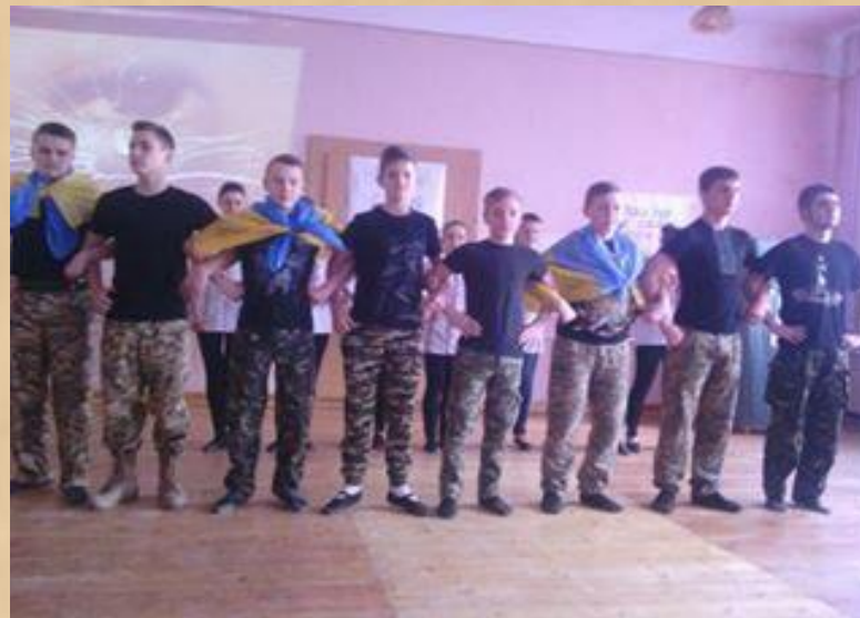
Бережанська гімназія ім. Б.Лепкого