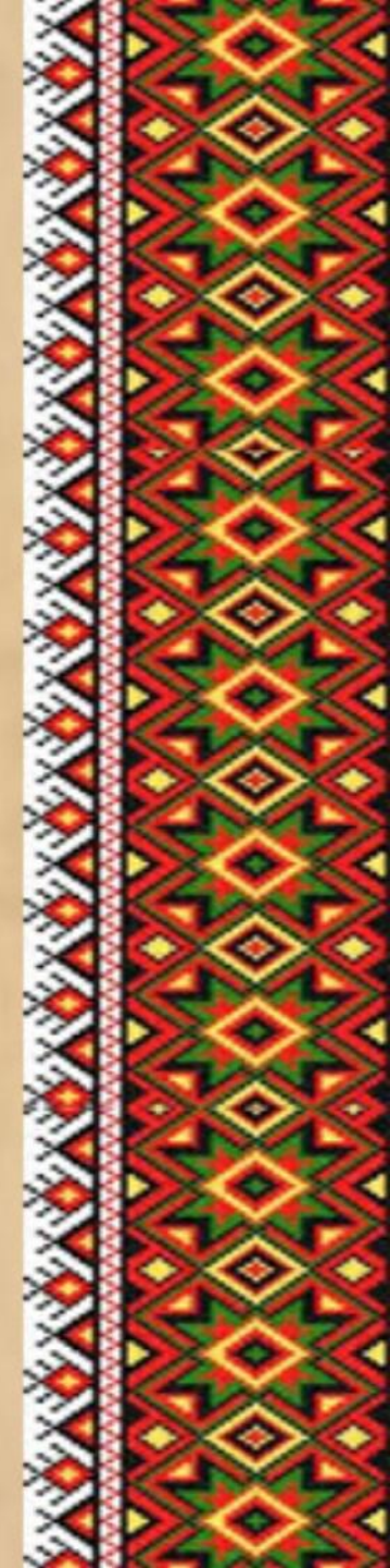
Бережанська ЗОШ №3