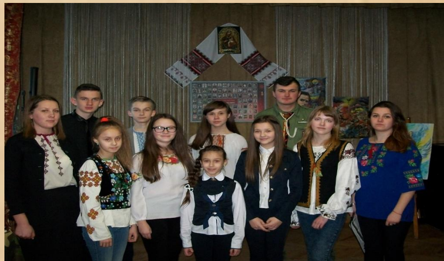
Центр дитячої та юнацької творчості