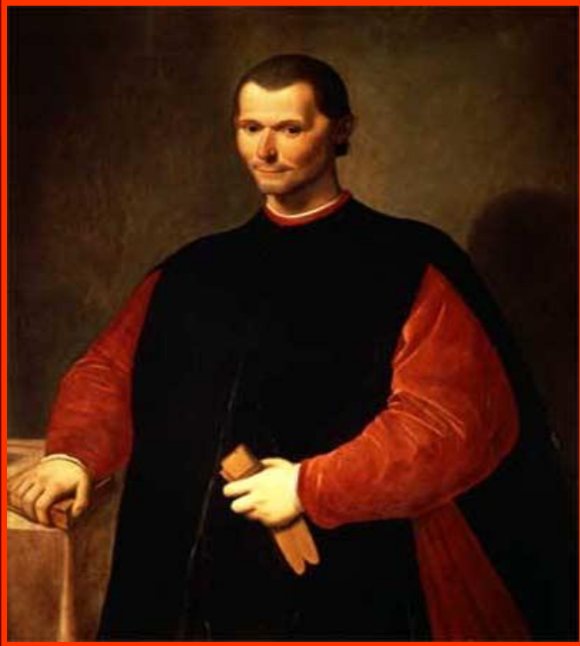
Никколо Макиавелли философ, политик, писатель (1469-1527) Флоренция

С течением времени образ Макиавелли стал одним из СИМВОЛОВ В истории европейской и мировой культуры