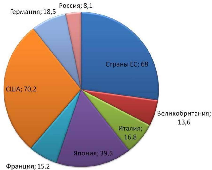
Численность занятых в сфере малого и среднего бизнеса, млн. чел.

В отличие от малого бизнеса, для которого работники - один из самых важных звеньев бизнес процесса, средний бизнес уже основную ставку делает на качество своих товаров и услуг. Большую роль для среднего бизнеса играет менеджмент. Хотя организация менеджмента намного проще, чем в крупном бизнесе, этим фирмам удастся быть маневренными и легко подстраиваться под изменчивый рынок.