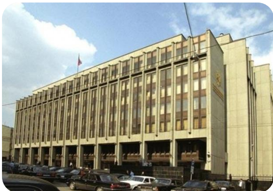
Здание Совета Федерации

Основная функция Совета Федерации – одобрение и корректировка законов, принятых Государственной Думой