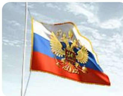
Штандарт Президента России

Обладает правом законодательной инициативы, утверждает законы, принятые Федеральным Собранием РФ