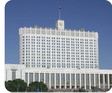
Здание Правительства РФ