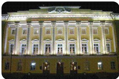
Конституционный Суд РФ

Судебный орган конституционного контроля. Обеспечивает соблюдение Конституции РФ, проверяет законы, принятые Федеральным Собранием и региональными органами законодательной власти на соответствие Конституции