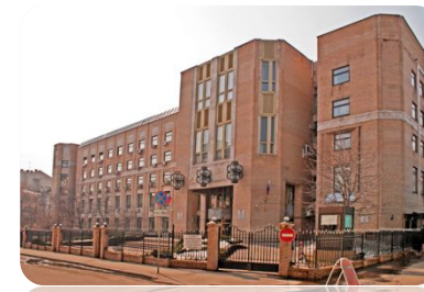
Высший арбитражный суд РФ

Суд высшей инстанции, в котором решаются все гражданские, административные и уголовные дела, не разрешенные в рамках рассмотрения дел судами нижних инстанций