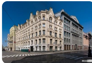
Верховный суд РФ

Судебный орган конституционного контроля. Обеспечивает соблюдение Конституции РФ, проверяет законы, принятые Федеральным Собранием и региональными органами законодательной власти на соответствие Конституции