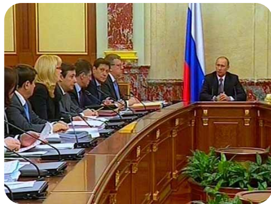
Зал заседаний Правительства