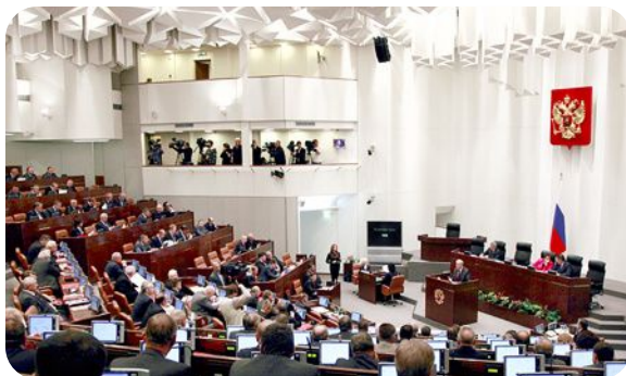
Зал заседаний Совета Федерации