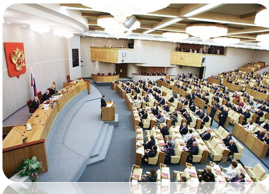
Зал заседаний Государственной Думы

Основная функция Государственной Думы – разработка и принятие федеральных законов