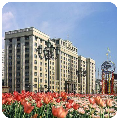
Здание Государственной Думы

Федеральные законы действительны на территории всей Российской Федерации