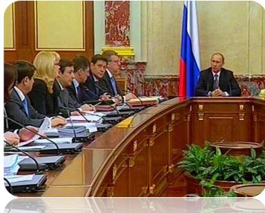
Заседание Правительства РФ