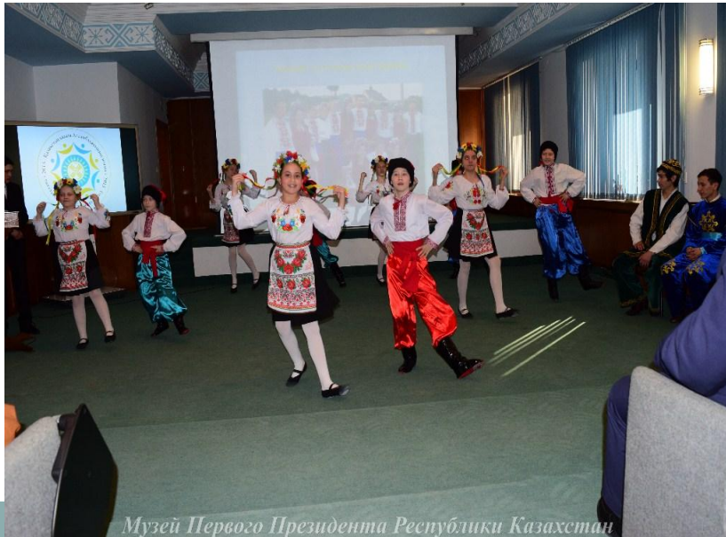
Музей Первого Президента Республики Казахстан

Подчеркивая роль молодого поколения для будущего страны, Н.А.Назарбаев особое внимание обратил на модернизацию образования, создание эффективной системы адаптации молодых казахстанцев к самостоятельной жизни, инициативному труду и др