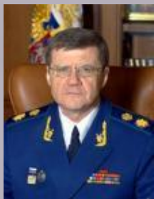
Чайка Юрий Яковлевич Генеральный прокурор РФ