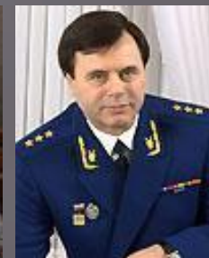
Буксман Александр Эмануилович Первый заместитель Генерального прокурора