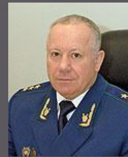
Сьдорук Иван Иванович Заместитель Генерального прокурора