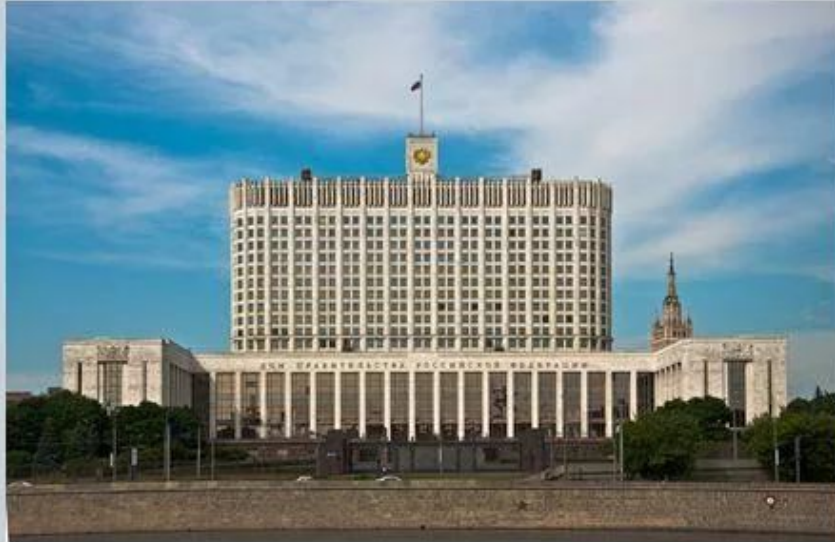
Дом Правительства РФ

Сайт Правительства РФ – http://government.ru/