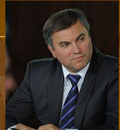
Вячеслав Викторович Володин с 5 октября 2016 года